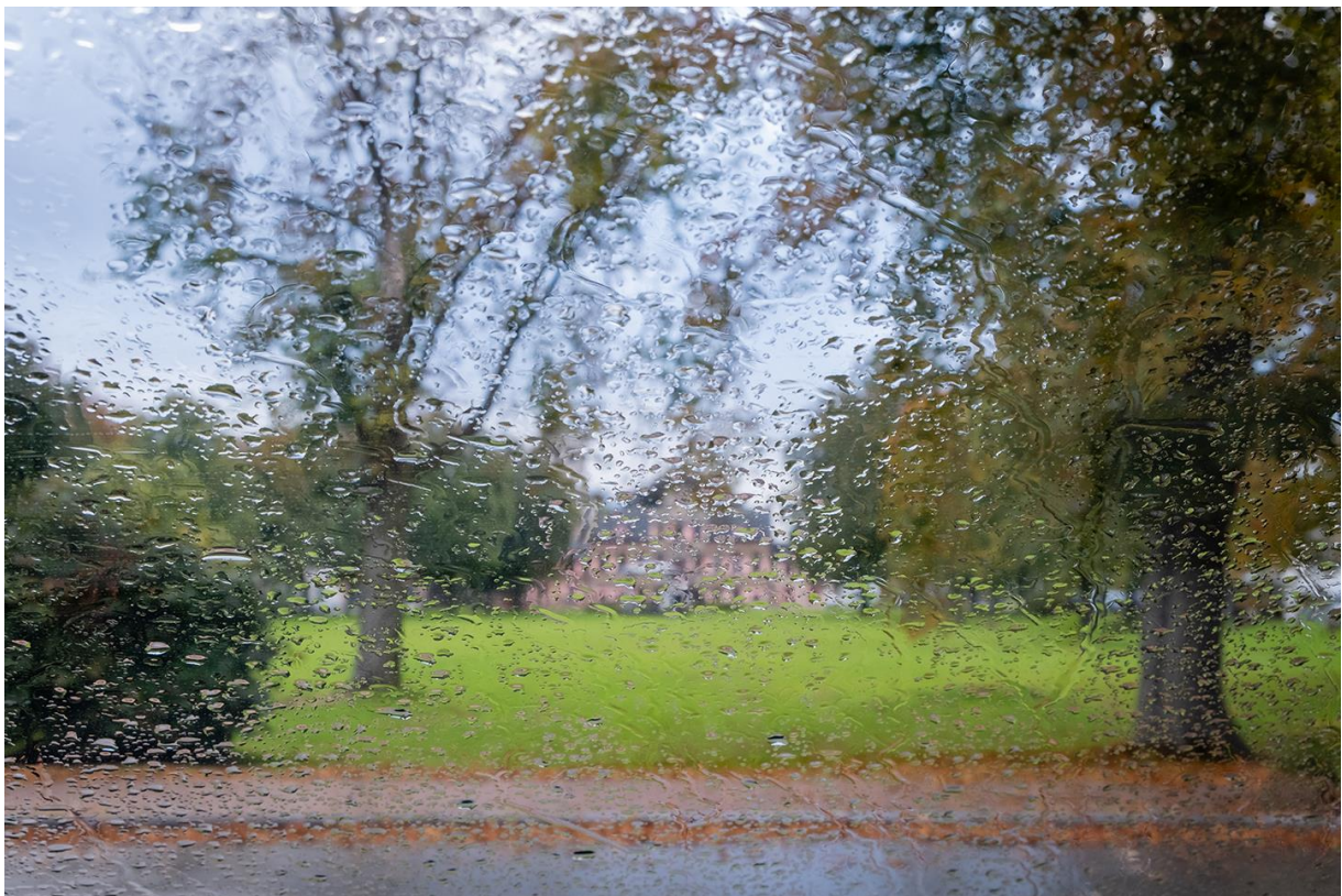
Riet Corneel: "Regen op het plein"