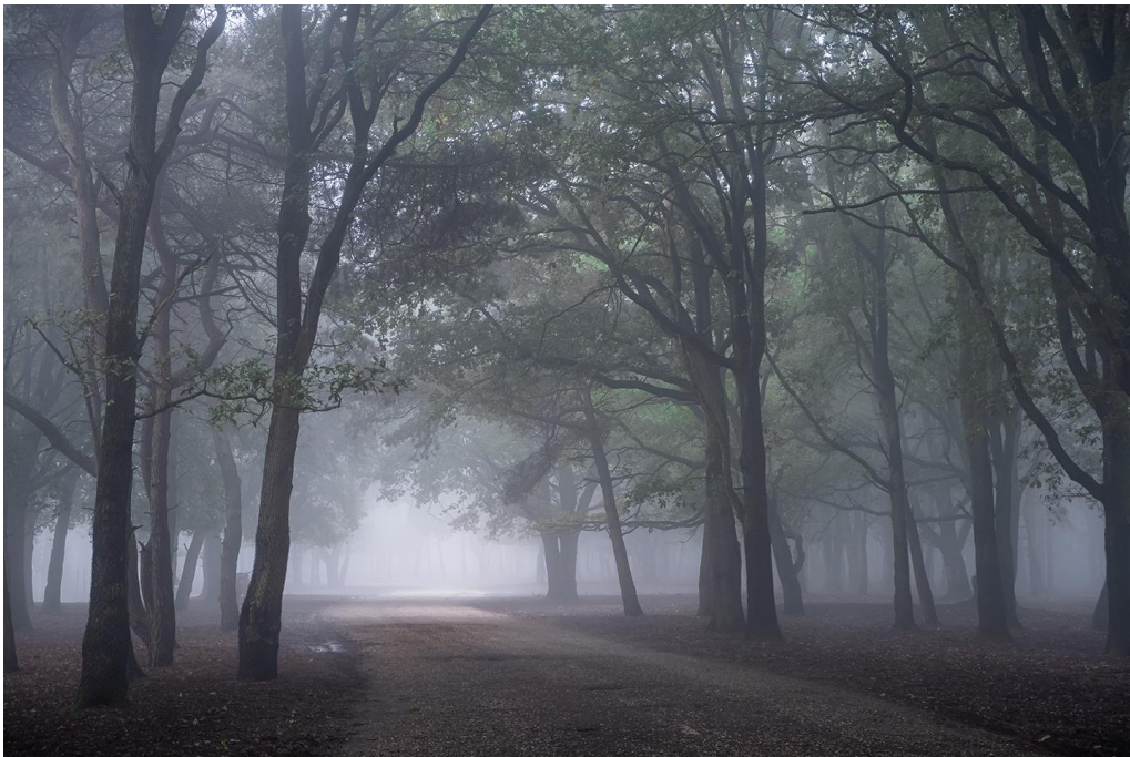
Riet Corneel – “Ochtendnevel”